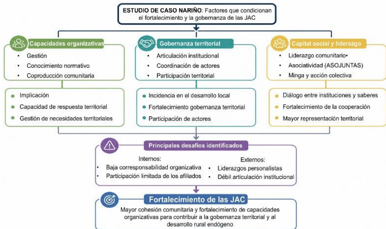
Figura 2. Factores que condicionan el fortalecimiento y la gobernanza de las Juntas de Acción Comunal: síntesis del estudio de caso de Nariño.