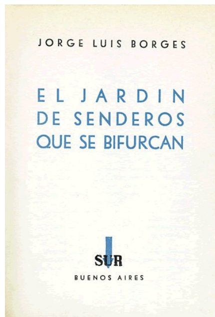
Figura 4. Libro: El jardín de los senderos que se bifurcan..

Enfoque científico integrado en el que la Ciencia, Tecnología, Ingeniería y Matemáticas forman un todo integrado.