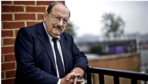
Figura 3. Umberto Eco. (Fuente: Infobae, 2016).

Umberto Eco 2 fue mucho más enfático: "Usted es periodista, yo soy profesor de universidad, y si accedemos a una determinada página web podemos saber que está escrita por un loco, pero un chico no sabe si dice la verdad o si es mentira. Es un problema muy grave, que aún no está solucionado." (Infobae, 2016).