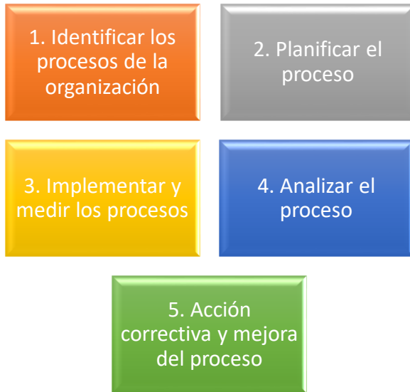
Figura 2. Modelo de enfoque de procesos de ISO 9000:2015.

metodología para implementar el mismo en las empresas. Esta metodología se presenta en la siguiente figura: