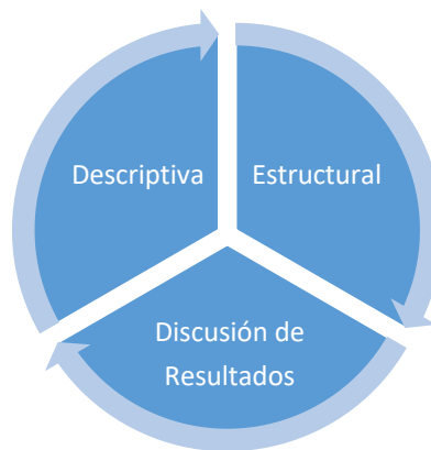
Fases de la Investigación