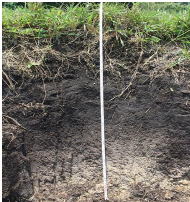
Figura 5. Calicata o cajuela de observación PMML004, coordenadas: W 73° 30.488' y N 04°05.308.

En la siguiente figura se observa como las calicatas descritas presentan probablemente una línea base de suelos (Figura 6).