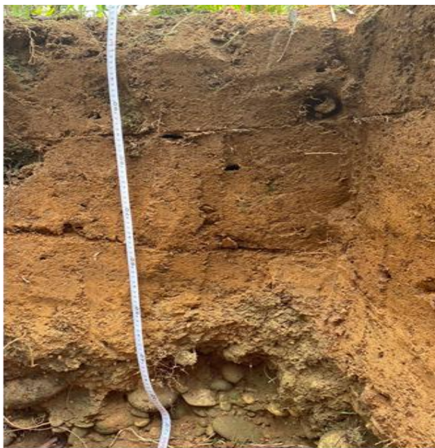
Figura 3. Calicata o cajuela de observación PMML002, coordenadas: W 73° 30'38.3" y N 04°05'41.9".