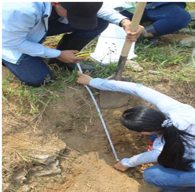
Figura 2. Calicata o cajuela de observación PMML001, coordenadas: W 73°30'33.5" y N 04°05'27.9".

en estado húmedo 10YR 3/3 y un pH ligeramente ácido (6). Se observaron pocos moteados finos y débiles, así como una baja cantidad (1 %) de fragmentos gruesos tipo grava, con redondez subangulosa, forma esférica y un grado de alteración fuerte. La estructura correspondió a un bloque subangular, con un grado de desarrollo débil y agregados de tamaño muy fino (Figura 3).