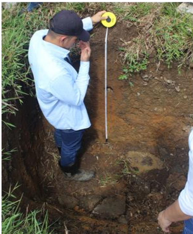
Figura 4. Calicata o cajuela de observación PMML 003, coordenadas: W 73° 30'23.7" y N 04°05'39.7".

Asimismo, se registró una baja proporción de fragmentos gruesos (1 %), con morfología subangulosa, forma esférica y un grado de alteración moderado. La estructura del suelo correspondió a bloques subangulares, con un desarrollo moderado. En cuanto a la consistencia, se observaron características similares a las del horizonte anterior en los cinco aspectos evaluados: dureza, friabilidad, adhesividad, plasticidad y compacidad. Además, se identificaron rasgos superficiales en un 25 % a 50 % del horizonte, los cuales eran comunes, continuos, de tonalidad clara y distribuidos en todas las caras de los agregados. Finalmente, se registró una baja cantidad de raíces muy finas y una actividad biológica reducida (Figura 4).