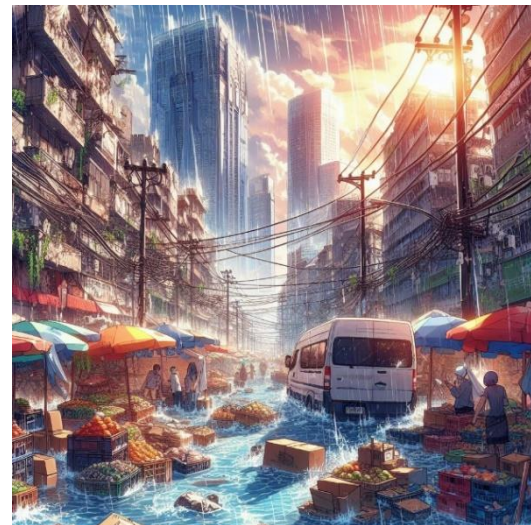
Fig. 6. Interfaz del primer mundo

La interfaz del juego presenta siete mundos distintos como se observan en las figuras 6 y 7, cada uno abordando aspectos específicos de la economía solidaria. Desde la introducción en un consultorio hasta la práctica de responsabilidad social, pasando por la proyección social y la docencia, el juego cubre una amplia gama de temas relevantes. Cada mundo se presenta con imágenes ilustrativas y animaciones que explican conceptos clave, acompañadas de audio y texto explicativo para enriquecer la experiencia del usuario.