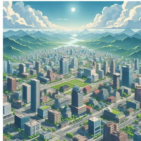
Fig. 2. Inicio de Juego

pretende no solo mejorar la experiencia de juego, sino también contribuir al desarrollo de habilidades empresariales [20].