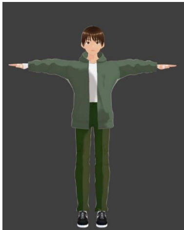
Fig. 5. Prototipo de personaje masculino

Además, la guía interactiva fomenta la colaboración y la interacción entre los participantes, creando un entorno de aprendizaje socialmente constructivo. A medida que los jugadores que se evidencian en las figuras 4 y 5, avanzan a través de los diferentes mundos y completan los desafíos propuestos, tienen la oportunidad de desbloquear recompensas y reconocimientos que refuerzan su progreso y motivación.