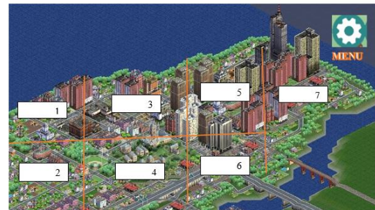
Fig. 3. Inicio de Juego

Como se observa en las figuras 2 y 3, a través de una serie de mundos interactivos recursos educativos y actividades evaluativas, la guía busca sumergir a los jugadores en los conceptos clave de la economía solidaria. Desde la comprensión de los macroprocesos del consultorio hasta la participación activa en proyectos comunitarios e institucionales, cada etapa del juego está diseñada para brindar una experiencia educativa integral y significativa.