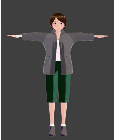
Fig. 4. Prototipo de personaje femenino Fuente: elaboración propia.