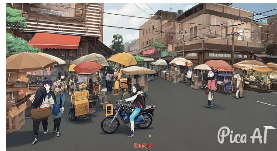
Fig. 7. Interfaz del segundo mundo

El diseño de los mundos y la presentación de la información se adaptan al estilo anime, utilizando gráficos y animaciones que capturan la atención del jugador. Además, se incorporan elementos interactivos, como rompecabezas y cuestionarios, para fomentar la participación y el aprendizaje activo. Con una combinación de estímulos visuales