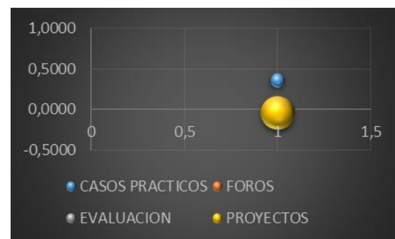
Fig. 1. Correlación de Pearson

En la figura 2 observamos dos resultados negativos o correlación negativa, mostrando que no hay dependencia entre las variables; en actividades grupales y en proyectos o reflexión sobre problemáticas, el índice indica que no hay concordancia de opinión entre docentes y estudiantes en estas prácticas, lo podemos apreciar también en la figura 1.