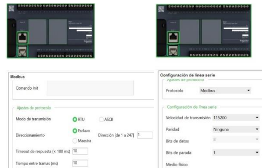
Fig. 2. Configuración serial y Modbus del PLC M221.