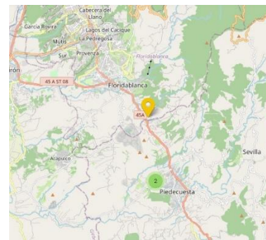
Fig. 5. Posición en mapa del PLC conectado.

El dispositivo conectado se presenta en un mapa interactivo donde, al hacer clic en el icono correspondiente, se despliegan los datos actuales del equipo junto con su última información enviada. La ubicación del PLC en el mapa se muestra en la Fig. 5.