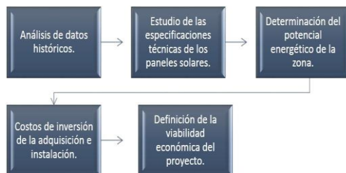
Fig. 3. Modelo de viabilidad Técnica- Económica de un Proyecto de Energía Fotovoltaica

A partir de la caracterización inicial es posible determinar las necesidades de ahorro energético de la organización, en la medida en que se identifican las áreas o procesos de consumo excesivo que pueden ser abordadas con medidas de intervención. Además, permite la incorporación de generación alternativa de energía con fuentes renovables para lo cual se debe hacer un análisis de viabilidad técnica y económica del proyecto de inversión (Figura 3).