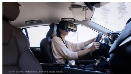
Figura 2. Ensayos del método de conducción de Volvo con el uso del visor XR – 1

Del mismo modo otras empresas altamente sofisticadas y de alto perfil como es el caso de la empresa de producción de automóviles Volvo, integran servicios de realidad aumentada tanto para el usuario final, en su experiencia de conducción como en el proceso de diseño de sus automóviles; esto con la ayuda del visor de realidad aumentada XR – 1, que cuenta con una resolución excepcional que permite a los conductores poder operar u automóvil mientras lo utilizan; aunque esta innovación apenas se encuentra en periodo de prueba y solamente se permite la operación de los automóviles con este equipo en las pistas de prueba de Volvo ubicadas en Suecia (López, 2019). (Ver Figura 2)