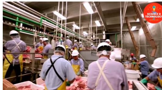
Figura 4. Proceso de clasificación de la carne en Varkenshandel Van Den Eijnden

selección y clasificación de los productos, tarea que aún resulta imposible para una máquina (Science & Technology UI, 2021) (Ver Figura 4)