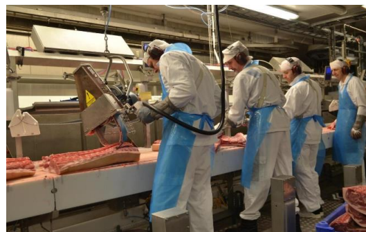
Figura 5. Actividades de corte no automatizadas dentro de la línea de producción de Norturas