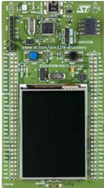
Fig. 2. Placa de desarrollo stm32f429I Disc0

En el desarrollo de la herramienta para la elaboración de interfaces gráficas se utilizó la placa de desarrollo STM32F429I-DISCO, esta placa se muestra en la Figura 2, y posee como características principales un microcontrolador ST Cortex M4 con oscilador 180 MHz, 256 Kbytes de memoria RAM, 2MB de memoria flash y una pantalla de cristal líquido TFT táctil de 2.4 pulgadas. Las características más detalladas pueden encontrarse en (ST Microelectronics, 2016).