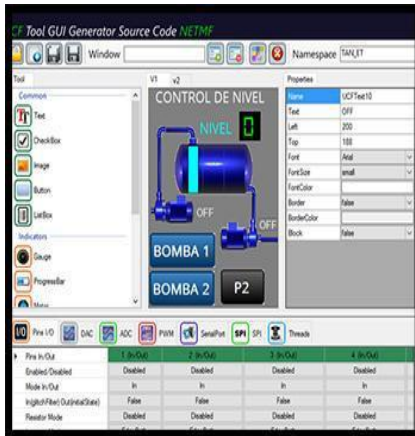
Fig. 3. Entorno de la Herramienta desarrollada para el diseño de interfaces gráficas

A continuación se describe brevemente la funcionalidad de los elementos de los que se compone el software: