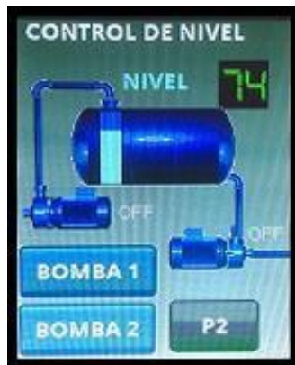
Fig. 9 Ventana 1 Interfaz de control de Nivel Implementado en la tarjeta STM32f429IDisc0

Esta práctica pretende a través de la pantalla táctil monitorear y controlar el nivel en un tanque. Posee controles tipo image que se usaron para cargar las imágenes correspondientes al tanque y las bombas de llenado y vaciado, controles tipo button para activar o desactivar los actuadores y para cambiar de ventana, la ventana 2 es una ventana solo para visualización que incluye controles tipo indicator que se activan en nivel bajo y alto y un control tipo plot para monitorear la variable de forma continua, incluye también esta ventana un indicador numérico a través de un control tipo text y un control tipo gauge que muestran el valor del nivel actual. La ventana principal y la segunda ventana de esta implementación se muestran en las figuras 9 y 10 respectivamente.