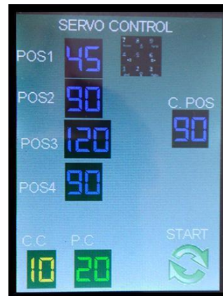
Fig. 7. Pantalla principal Interfaz de control de posición con servo motor. Implementado en la tarjeta STM32f429IDisc0

En esta práctica se busca realizar una secuencia de 4 posiciones angulares de un servomotor, la interfaz permite configurar dichas posiciones en valores entre 0 y 180 grados que se configuran a través del uso del teclado de la herramienta, esta interfaz incluye 6 controles tipo image correspondientes al teclado pequeño que conducen a una segunda ventana donde se encuentra el teclado alfanumérico Keypad para configurar cada posición del servomotor digitando el valor en grados que se desea, también permite configurar el número de repeticiones que se desea realizar la secuencia. La interfaz incluye 7 indicadores tipo text , uno por cada posición configurada, uno que muestra la posición actual del servomotor ( C. POS ), otro para indicar el número de repeticiones configuradas ( P.C ) y el último para visualizar el ciclo en el que se encuentra ( C.C ). La interfaz se visualiza en las figuras 7 y 8.