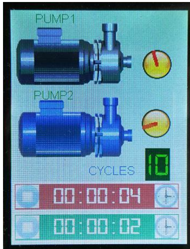
Fig.5. Control de 2 motores temporizado implementado en la tarjeta STM32f429IDisc0.