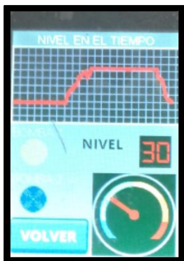
Fig. 10. Ventana 2 Interfaz de control de Nivel Implementado en la tarjeta STM32f429IDisc0