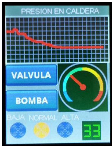
Fig. 6. Interfaz de control de presión. Implementado en la tarjeta STM32f429IDisc0.

En esta práctica se busca la configuración y visualización de variables analógicas. El sistema monitorea la presión en una caldera y para esto se diseña una interfaz que incluye un control tipo Gauge para la visualización de esta variable, un control tipo text para la indicación numérica del valor actual de la variable, tres controles indicator para niveles predeterminados de Presión baja, media, alta, dos controles tipo button para activar salidas correspondientes a una válvula y una bomba, además un control tipo plot para el registro continuo en el tiempo de la variable. La implementación de la interfaz en la tarjeta se muestra en la Figura 6.