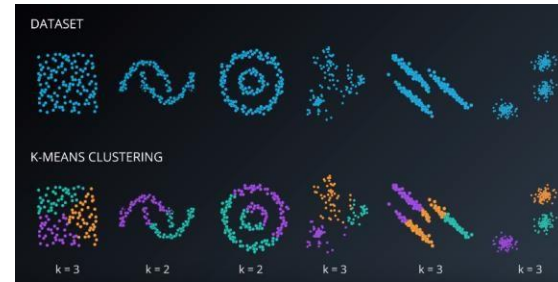
Fig. 6. Ejecución del algoritmo k-means.

Una vez programado el algoritmo se obtuvo gráficas para ir interpretando las interacciones del algoritmo e ir refinando el valor de K, el cual nos otorga el mejor agrupamiento de los clientes.