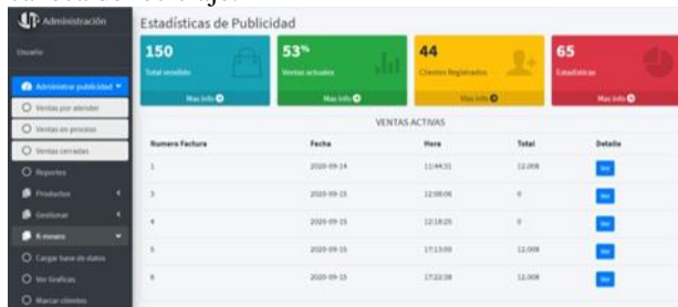
Fig. 4. Menu administrador.

categoría específica, el algoritmo debe ser ejecutado por el administrador periódicamente para obtener mejores resultados ya que los clientes de la app una vez rediman puntos en las tiendas de los aliados estos deben poderse categorizar todo el tiempo, de esta manera vamos a tener una circulación de publicidad dinámica en la app de la caneca de reciclaje.