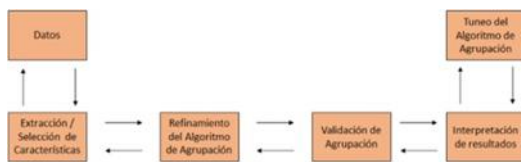
Fig. 3. Implementación K-means.

La caneca está construida en base a un sistema que permite asignar puntos de acuerdo a la cantidad de material reciclado basados en el peso introducido en la caneca, entre más es la cantidad de plástico más son los puntos asignados, cuando se trata de almacenar algún elemento que no es plástico el sistema genera un alerta y no asigna puntos, para dar soporte al sistema se utilizó un sensor de barrera por reflexión R201 Fotoeléctrico (Vega et al., 2020). El cual permite la detección de los elementos de material plástico.