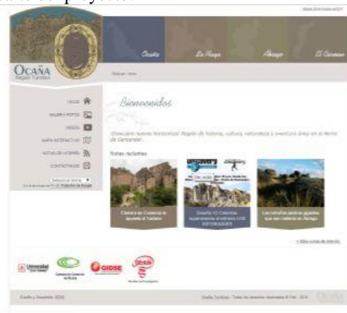
Figura 1: Interfaz página de turismo

Las interfaces creadas, se fundamentan en la información recolectada en las etapas anteriores, como se muestra en la figura 1. Este sitio web www.ocanaturistica.com cuenta con un nombre de dominio propio que brinda fácil recordación y acceso y un traductor para que visitantes de habla inglesa puedan consultar y enterarse de las características y facilidades de los lugares incluidos dentro de cada uno de los municipios que hicieron parte del proyecto.