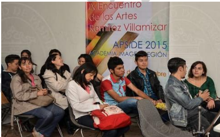
Figura No. 3. IX Encuentro de las artes ramirez villamizar. apside 2015

Colateralmente, la formación de los futuros egresados ha sido permeada con acciones realizadas desde procesos de investigación e interacción social, como terreno importante para el reconocimiento de la gestión cultural como actividad de vital importancia para la circulación y/o proyección de proyectos y patrimonio cultural. Al respecto cabe mencionar entre otros, el reconocimiento obtenido por la Maestra Rosa Isabel Moncada al frente de proyectos APSIDE (encuentro de formadores artísticos 2000) (ver figura No.5) el cual se constituyó en su momento como un espacio significativo de interacción de artistas, docentes y estudiantes, de diversos programas académicos en los que se intercambiaron desde las ponencias y talleres, miradas regionales y académicas en el contexto de la educación superior. Por otra parte, los SILEA (semillero infantiles de libre expresión) (ver figura No. 6) que se ha ido constituyendo en un espacio de educación artística infantil con una tradición de 18 años, de los cuales 8 han sido concertados por el Ministerio de Cultura; dichos semilleros que hacen parte de la vicerrectoría de interacción y extensión social permite la práctica de estudiantes de los programas de artes visuales y pedagogía infantil donde las prácticas artísticas realizadas por los niños de Pamplona se convierten en un laboratorio de convivencia, aprendizaje y respeto por el mundo de la creatividad.