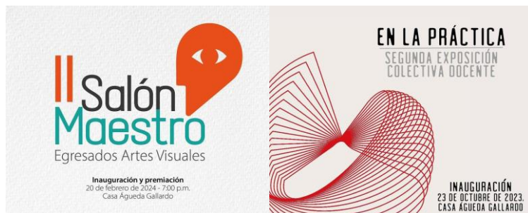
Figura No. 9. eventos del programa de Artes Visuales.

El programa de Artes Visuales de la Universidad de Pamplona se ha posicionado en el contexto regional fronterizo y regional con un alto nivel de representatividad dentro de las ofertas nacionales programa relacionados con las artes, permeado con un espíritu interdisciplinar para la contribución del quehacer dinámico y que proporciona la apropiación de elementos de la realidad que permitan reflexionar sobre el mundo que deseamos, y que desde el entorno inmediato en que se encuentra la Universidad de Pamplona se provean los futuros Maestros en Artes Visuales..