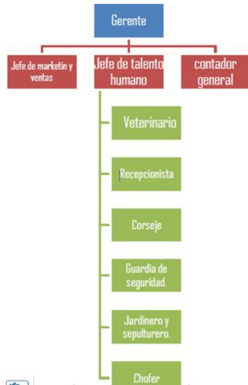
Figura 5. Organigrama. (Fuente: Elaboración propia, 2021).