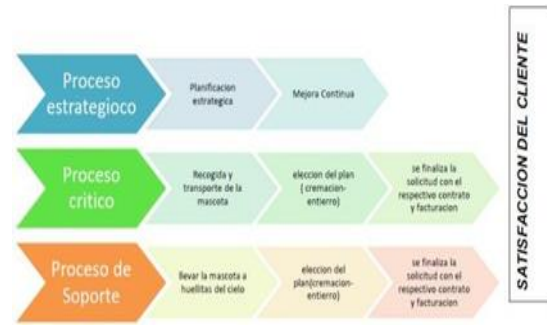
Figura 5. Procesos.

Modificamos la forma de los diseños y colores a base del gusto de los clientes de los productos de las urnas y lapidas.