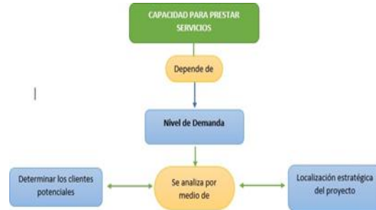
Figura 3. Tendencias.

Al estar familiarizado con la zona donde se implementará nuestro proyecto, podemos calcular o estimar el nivel de clientes que obtendremos. Por ende, podemos determinar nuestra capacidad a la hora de ofertar o prestar dichos servicios.