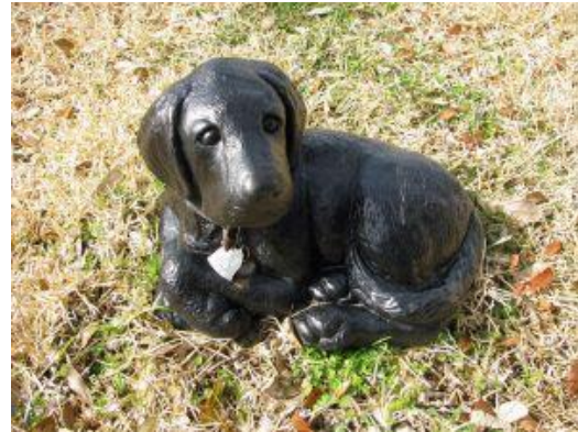
Figura 1. Estatua canina en cementerio. (Fuente: Eroski Consumer, 2012).

Cementiri des petits animals (2017), se ofrecen los servicios de nichos (€99 a 119€), fosas (€149) y hasta alquileres, entre otros.