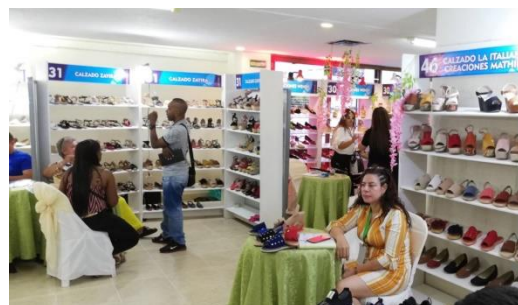
Figura 1. Calzado en Cúcuta.

Por lo anterior, el calzado necesita estrategias que contribuyan a una mejora en la productividad de los procesos, mejoras que ayuden a impulsar estos rendimientos en cuanto a productividad y aporte a la economía regional.