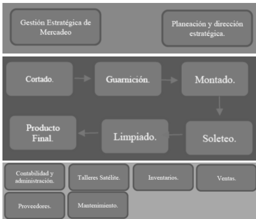
Figura 3. Mapa de procesos. (Fuente: elaboración propia, 2020).