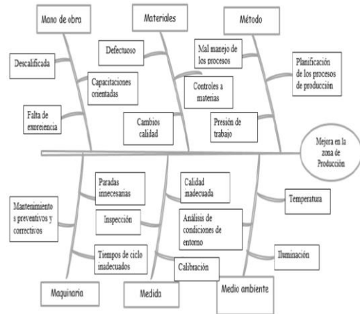
Figura 6. Diagrama Causa Efecto.