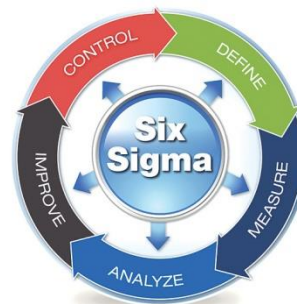
Figura 2. Six sigma.

una cifra de 3.4 errores o defectos por millón de oportunidades, lo que llega a disminuir los errores a un punto muy poco significativo e implica que en cierta parte se convierte en una metodología preventiva debido a que al disminuir el margen de error a un punto tan bajo se pueden prevenir los errores antes de que sucedan en el proceso.