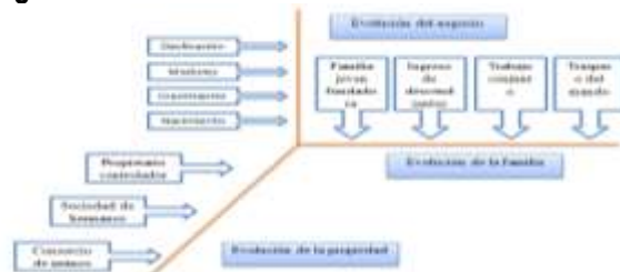
Figura 3. Modelo Evolutivo Tridimensional