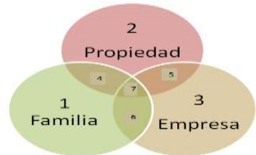
Figura 1. Modelo de los Tres Círculos

Elaboración propia basada en (Molina, 2012).