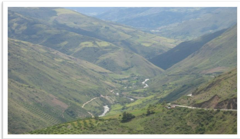
Hoya Río Chitagá

Conservando la estructura de producción que ha sido tradicional en la región, el 76.3% de los productores son propietarios de la tierra y la cultivan directamente. El 23.7% se distribuye entre aparcería 6.7% y el 17% cultivos de compañía donde mediante contrato, el propietario coloca la tierra y el socio siembra, repartiéndose la producción.