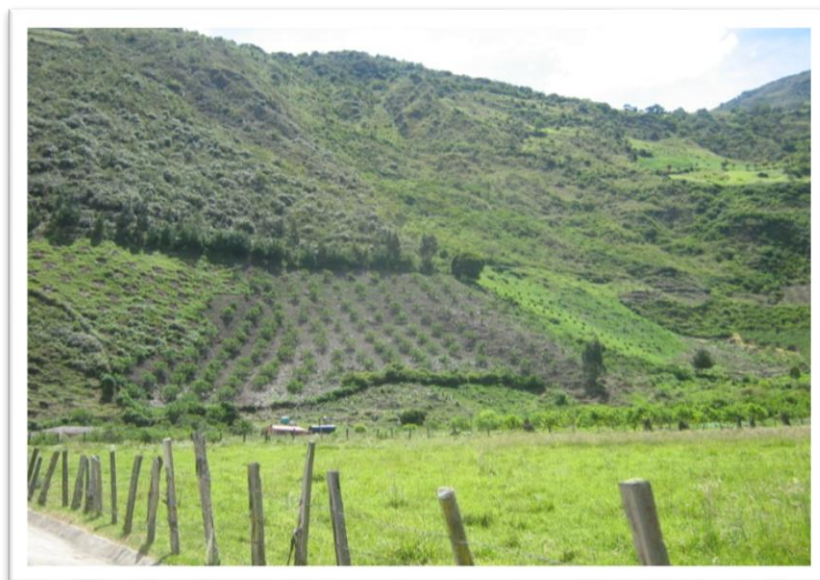
Cultivo de durazno, Vereda Icota

Los productores de durazno han empezado a percibir las señales de precios que les lanza el mercado, entienden que una hectárea de durazno le puede rentar en un año un mínimo de $40.800.000, que puede perfectamente incrementar con la atención adecuada a sus cultivos, alcanzando rendimientos por árbol mayores (en la región existen arboles que produce año 600 Kg.), entiende adicionalmente que su producto no tiene sustitutos cercanos en el país y que su precio solo se ve modificado cuando ingresan al país los duraznos provenientes de Chile y que la inversión inicial mas las que tienen que realizar en cada periodo, pueden estar seguras pues los rendimientos de sus lotes son de largo plazo.