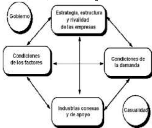
Figura 1. El Diamante de Porter.

y, ante los cuales, las empresas deben estar atentas para la toma de decisiones estratégica que pueden ayudar a aperturar nuevas oportunidades, o bien, estancar a las organizaciones.