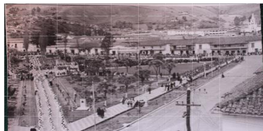
Vista del Parque Águeda Gallardo, fecha aproximada 1950-1960