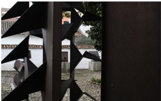
Escultura del Maestro pamplonés Eduardo Ramírez Villamizar, ubicada en el museo que lleva su nombre.

-Simón Bolívar, Libertador de cinco naciones pernoctó en esta ciudad en varias oportunidades, ante ello, se imaginó que su arribo a la ciudad era todo un acontecimiento, al igual que su corta instancia del General Nariño cuando tradujo los “Derechos del Hombre” y deja una copia de este documento en casa de Doña Águeda Gallardo.