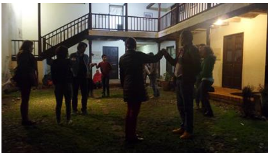
Ensayo danza la Vencedora, (2015) Museo Casa Anzoátegui.

acompañaron este recorrido nocturno oyendo, disfrutando y aprendiendo de las historias de la ciudad Pamplona. El compartir por lo general y sin salirnos del objetivo patrimonial se ofrece un plato típico, patrimonio inmaterial de la ciudad que aún sigue vigente en nuestras mesas el “tamal pamplonés” acompañado de una bebida como el café típico colombiano o un chocolate.