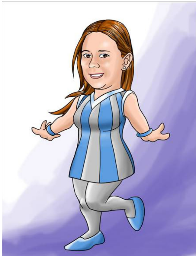
Imagen 9. Personaje Fonolinda.

Es una hermosa jovencita que algunas veces es atacada por los villanos, adoptando malos hábitos y acude a Súper Fono para ser salvada. Se caracteriza por utilizar una blusa manga sisa de color gris y rayas azules, un legins gris y baletas azules. La imagen 9 representa este personaje.