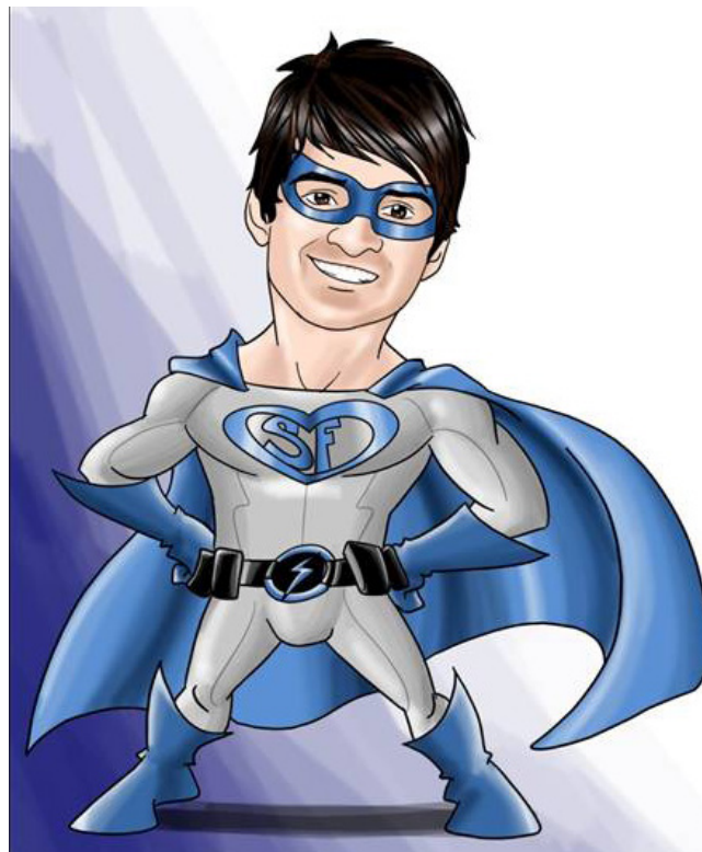
Imagen 7. Personaje Súperfono