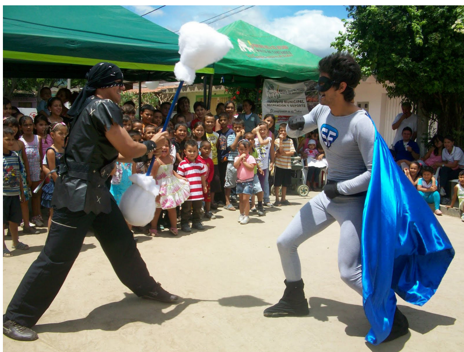
Imagen 2. Súperfono año 2011