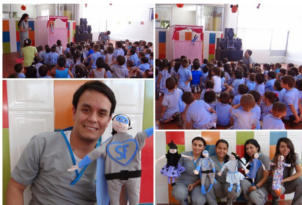
Imagen 6. Títeres de la “Liga Súperfono”