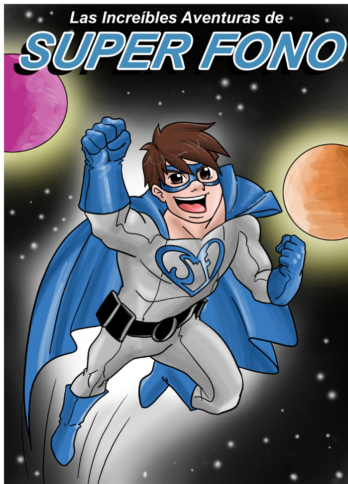
Imagen 5. Cómic “Las Increíbles Aventuras de Súperfono”