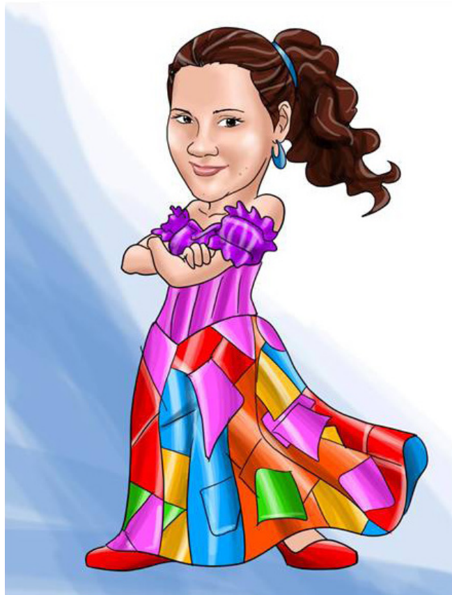
Imagen 10. Personaje Señora Sabelopoco

Es la tía gritona y descuidada. Con sus pocos conocimientos sobre como tener una buena comunicación, da recomendaciones y enseñanzas incorrectas a los niños, induciendo malas conductas en el auto cuidado de la salud comunicativa. Se caracteriza por utilizar una blusa rosada con una falda larga de colores. En la imagen 10 se representa este personaje.