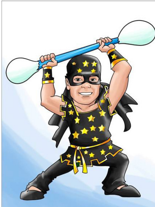
Imagen 13. Personaje Señor Copito

¡Es el enemigo número uno de la audición! Promueve en todo el mundo malas conductas en la limpieza del oído, con el objetivo de crear grandes tapones de cerumen perjudicando la audición. Su vestuario se caracteriza por un traje de color negro con estampado de estrellas amarillas y un copito en forma gigante. La imagen 13 representa este personaje.