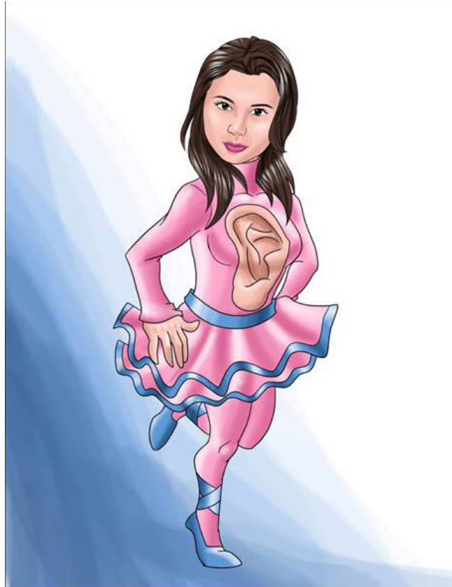
Imagen 8. Personaje Señora Orejita.

Es una de las mejores amigas de Súper Fono, con ternura y comprensión explica a los niños cómo es la limpieza del oído, siendo de gran colaboración para nuestro súper héroe. Se caracteriza por utilizar una trusa manga larga, tutu y baletas de color azul, en la parte de su tronco una orejita de color piel. La imagen 9 representa este personaje.