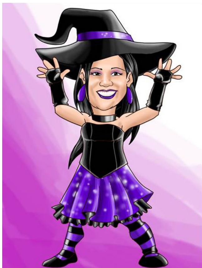
Imagen 11. Personaje Cruela

Es la líder malvada de los villanos, se encarga de enseñar a los niños malos hábitos y comportamientos que afectan la salud de los niños y adultos. Quiere destruir a súper Fono junto con su batallón de malvados. Su vestuario se caracteriza por utilizar un gorro negro con cinta entrecruzada morada, una trusa negra manga larga con un tutú morado y baletas negras. Este personaje se expone en la imagen 11.