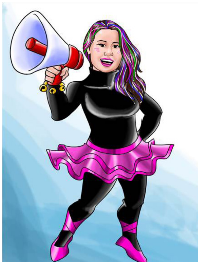
Imagen 12. Personaje Ruidosina

Grita todo el tiempo y hace mucho ruido! Su misión es hacer que los niños esfuercen su voz y pongan en peligro su audición en espacios ruidosos, aumentando así, alteraciones en la comunicación. Su vestuario se caracteriza por una trusa manga larga negra con un tutú rosado con negro, collares de pitos, auriculares, en las muñecas en forma de manilla cascabeles y unas baletas negras. El personaje es representado en la Imagen 12.