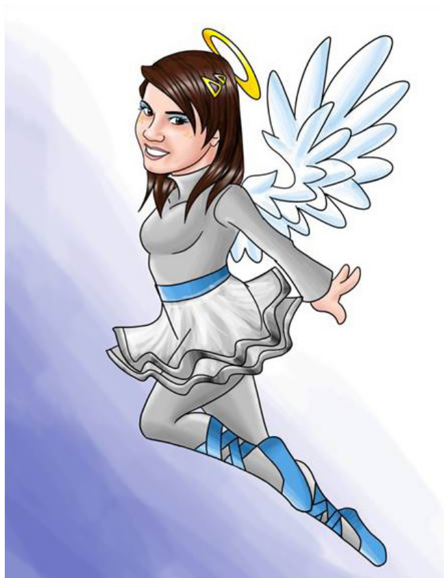
Imagen 8. Personaje Angelina

Son hermosos ángeles informan y ayudan a Súper Fono a detectar cualquier anomalía respecto a la comunicación del ser humano. Además le ayudan a combatir a los villanos, enviados por la malvada Cruela. Su vestuario se caracteriza por utilizar una trusa manga larga gris claro con un tutu de color azul, alas blancas y baletas grises. Uno de estos personajes se representan en la imagen 8.