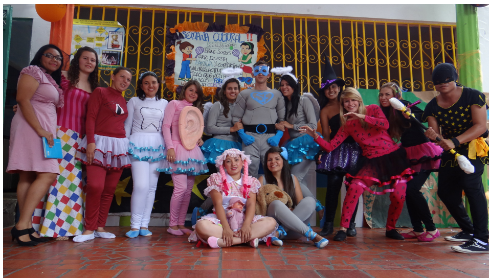
Imagen 3. Súperfono año 2012