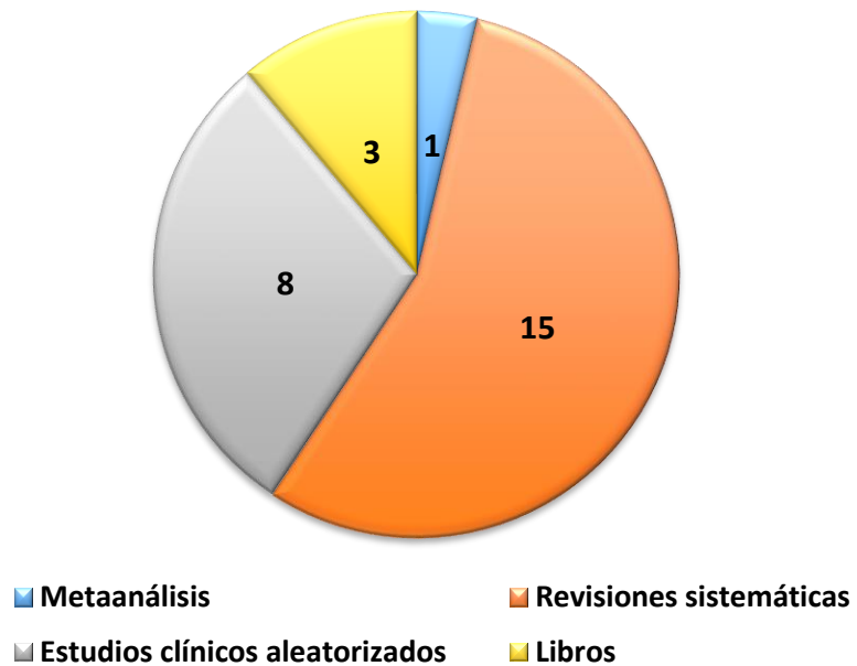
Figura 1. Tipos de estudio de los artículos- Lenguaje comprensivo

e) Etapa de identificación del nivel de evidencia: Los artículos seleccionados se categorizaron según los tipos de estudio de cada uno, como se observa en las Figuras 1 y 2.