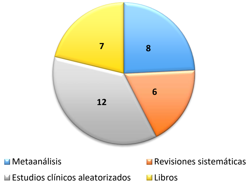
Figura 2. Tipos de estudio de los artículos – Lenguaje expresivo