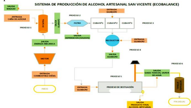
Figura 2: Eco-balance de los procesos de la destilería San Vicente.

Eco-balance: En los 6 procesos que tiene la cadena productiva del alcohol artesanal, se emplean diferentes entradas y salidas tanto de materia prima como de residuos. En la primera etapa que consiste en la molienda se manifiesta la generación de residuos debido a la salida de bagazo y guarapo (jugo de caña). En la figura 2, se muestra cada proceso: