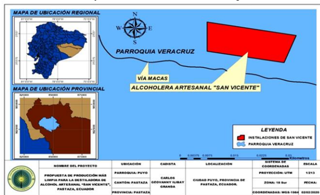
Figura 1: Ubicación de la destilería artesanal "San Vicente".

La destilería San Vicente se encuentra ubicada en la provincia de Pastaza, cantón Pastaza, parroquia Veracruz, km 8 ½ vía Macas, dentro de la cual existe un clima cálido – húmedo, con temperaturas medias de 18 °C y 25 °C.