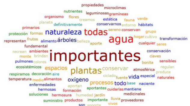
Figura 2. Nube de palabras con percepción de actores de la vereda El Páramo con relación a la vegetación.