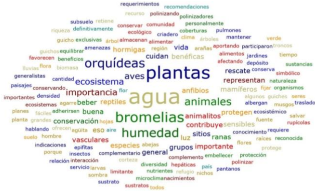
Figura 3. Nube de palabras con percepción de actores sociales de la vereda El Páramo con relación a la flora epífita.

A continuación se muestran algunas percepciones mencionadas (no se hace mención de los nombres de los entrevistados debido a confidencialidad de datos):