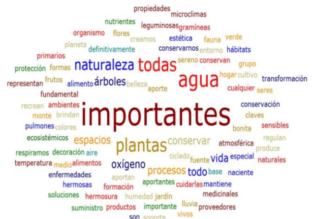
Figura 2. Nube de palabras con percepción de actores de la vereda El Páramo con relación a la vegetación.