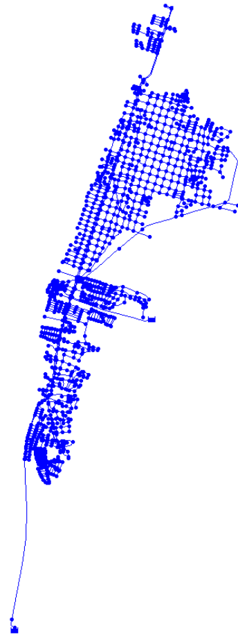
Figura 1. Modelo general red de distribución de Los Patios.

La red de distribución tiene 2 fuentes de suministro de agua desde la Planta de tratamiento de agua potable (PTAP) y la longitud de tuberías en toda la red es de 143.98 kilómetros con diámetros de tuberías que varían entre 62 y 400 milímetros. Con tuberías en materiales tales como asbesto cemento (AC), hierro fundido (HF) y polietileno de alta densidad (PEAD). El transporte de agua se realiza desde la planta de tratamiento y de un embalse ubicado al sur de del municipio, en la Figura 1 se puede observar el modelo hidráulico de la red de distribución el cual consta de 1354 nodos de demanda y 1834 tuberías.