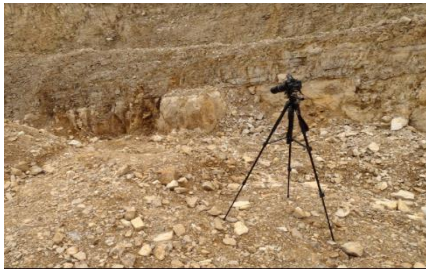
Figura 6. Cámara de alta resolución

La prueba 2 corresponde a la detonación de los bloques 1 (con doble recubrimiento de poliurea) y bloque 3 sin recubrimiento, se empleó 64 gr de indugel de 26 mm. El bloque 3 se cebó con un detonador N°8 mientras que el bloque 1 con un detonador eléctrico permisible debido a la no disponibilidad de los detonadores N°8 durante la prueba. Con la finalidad de recopilar información detallada de las detonaciones se instaló una cámara de video, Fig. 6, de alta resolución, para grabar el momento de las detonaciones.