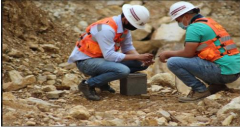
Figura 5. Preparación de cargas

bloque 2 (con un recubrimiento de poliurea y del bloque 4 Sin ningún tipo de recubrimiento, ambos cargados con 81 gr de indugel 26 mm cebado con detonador común N° 8 y mecha de seguridad.