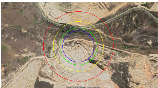
Figura 15. Radios de acción

En casos en que un polvorín se encuentre ubicado en zonas urbanas cercanas a un proyecto, se debe tener en cuenta el desplazamiento de proyecciones en caso de ocurrir un evento de detonación del material almacenado. Después de realizar el escalamiento a las medidas tomadas de los fragmentos de cada polvorín de prueba podemos ilustrar este punto en la siguiente imagen, (Fig. 15), donde podemos observar el posible radio de acción que tendría una explosión de los diferentes polvorines de tamaño real al estar ubicados en el lugar en que se hizo las pruebas (cantera La Roca).