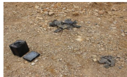
Figura 13. Fragmentos recolectados Bloque 1.

Al finalizar la prueba es evidente como la poliurea ofrece una resistencia adicional a los bloques, junto con su adherencia; evitando que los bloques durante la detonación se proyectaran en fragmentos de menor tamaño, haciendo que estos salieran proyectados en fragmentos más grandes adheridos a la capa de poliurea, Fig. 13, provocando esto un menor distanciamiento en las proyecciones en comparación a los bloques sin recubrimiento.