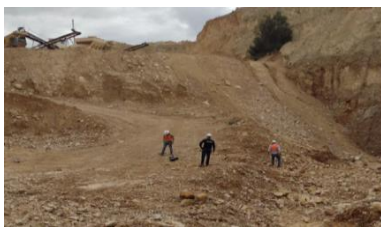
Figura 7. Búsqueda de Fragmentos

Se recolectó información mediante registro fílmico y fotográfico de estas pruebas. Adicionalmente, a cada detonación se procedió a realizar la búsqueda y recolección de fragmentos proyectados de los bloques se observa en la Fig.7, para analizar el tamaño de las proyecciones y poder establecer un radio de distribución de dichos fragmentos.