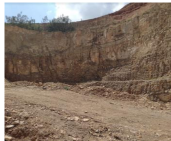
Figura 4. Área de Pruebas

La prueba se llevó a cabo en un área aislada y segura en la cantera la Roca, Fig. 4, donde las paredes de los taludes pudieran proteger de cualquier posible proyección a gran distancia y donde no alterase la tranquilidad de la comunidad.