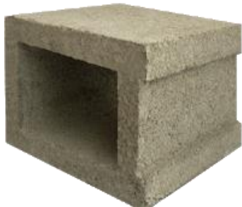
Figura 1. Bloque M -14

Para realizar el prototipo a escala, Fig. 1, del polvorín se utilizó el bloque M-14 que tiene las siguientes características: peso 6kg, ancho 14 cm, alto 19 cm y largo 19 cm.