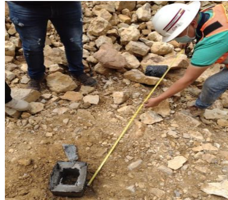
Figura 12. Proyecciones Bloque 1.

La proyección de fragmentos que se produjo se muestra en la Fig. 12, solo dos fragmentos se proyectaron del bloque. La arista superior quedó a una distancia cercana de 1,2 m del sitio de la detonación.