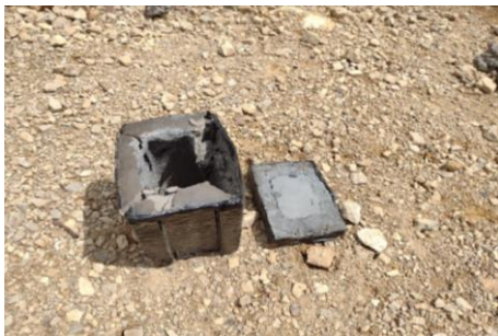
Figura 11. Fragmentos Bloque 1.

De igual forma la detonación del bloque número 1 se realizó con 64 gr de indugel, este bloque tenía una doble capa de recubrimiento con poliurea. Debido a la falta de detonador común fuerza 8, para esta prueba se empleó un detonador eléctrico permisible de fuerza 10 como medio de iniciación lo que deriva en una mayor facilidad para la iniciación del explosivo, pues este detonador ofrece una mayor energía de iniciación al explosivo, esto no altera las propiedades del explosivo al realizar su trabajo.