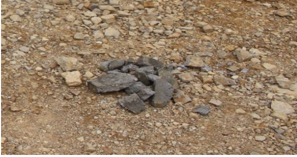
Figura 10. Fragmentos del bloque 3

La fragmentación del bloque 3 que se observa en la figura, alcanzaron los 14 metros de distancia dejando escombros del bloque visibles, que fueron recolectados, esta vez las proyecciones no causaron mayor sensación de riesgo pues cayeron lejos de la zona del personal presente. En este caso igualmente se realizó la búsqueda de los fragmentos alrededor de la zona de detonación, la búsqueda se facilitó debido al tamaño de los fragmentos generados.