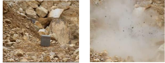
Figura 8. Detonación Bloque 4

correspondió al bloque 4, dicho bloque cargado con 81 gr de Indugel de 26 mm, quedo completamente fragmentado.