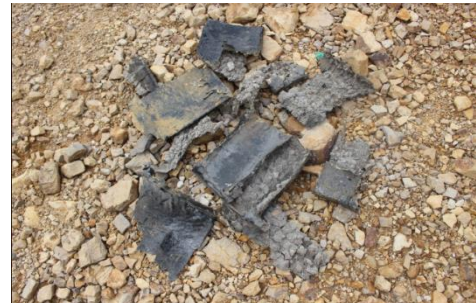
Figura 9. Fragmentos Bloque 2

En la detonación del bloque 2, prueba 1, Fig. 9, los fragmentos resultantes fueron de mayor tamaño y las distancias que recorrieron fueron bajas hasta 9 metros, una distancia mucho más reducida en comparación con la detonación del bloque 4, en este caso no se sintió caída de pequeños fragmentos cerca de la zona de observación.