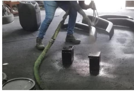
Figura 2. Aplicación de Poliurea

Bloque 1. Bloque con doble recubrimiento en poliurea, recubrimiento total de 525 gr de poliurea.