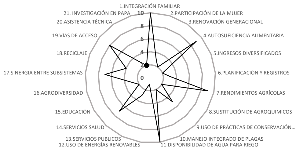
Figura 4. Sostenibilidad del sistema de producción de papa en el municipio de Concepción

y recursos son las que más contribuyen a la estabilidad del sistema productivo, mientras que las variables de buenas prácticas agrícolas y de transferencia de tecnología son las que colocan en peligro el sistema de producción de papa (ver figura 4).