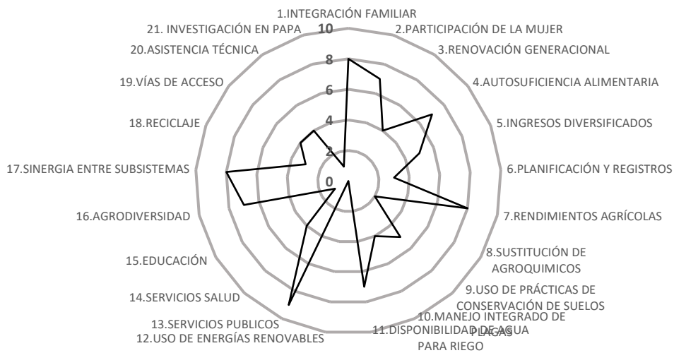
Figura 3. Sostenibilidad del sistema de producción de papa en el municipio de El Cerrito

aunque con un puntaje inferior al municipio de Guaca, igualmente son las que más contribuyen a la estabilidad del sistema productivo, mientras que la variable de transferencia de tecnología es la que coloca en peligro al sistema de producción de papa (ver figura 3).