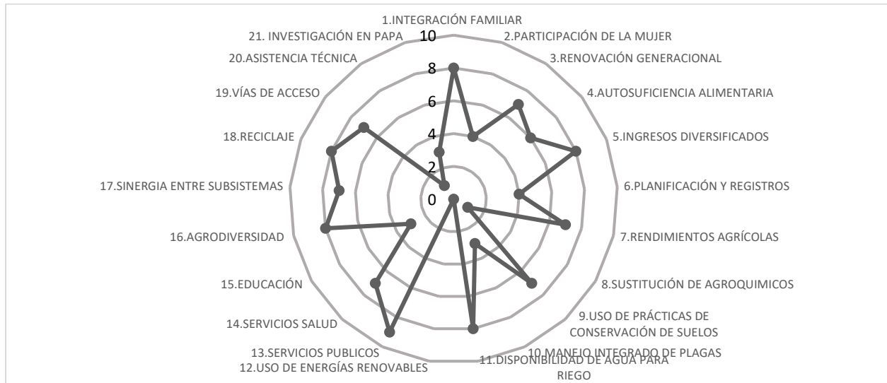
Figura 5. Sostenibilidad del sistema de producción de papa en el municipio de Cácuta

Para el caso del municipio de Mutiscua un resultado con 151/210 puntos, lo que corresponde a moderadamente sostenible o estable; donde los indicadores para las variables: núcleo familiar, servicios, diversidad y sinergias, son las que más contribuyen a la estabilidad del sistema productivo, mientras que la variables buenas prácticas agrícolas es la que coloca en peligro el sistema de producción de papa, las demás variables tienen valores intermedios, lo que resulta ser curioso ya que éste municipio es el que más a avanzado en el