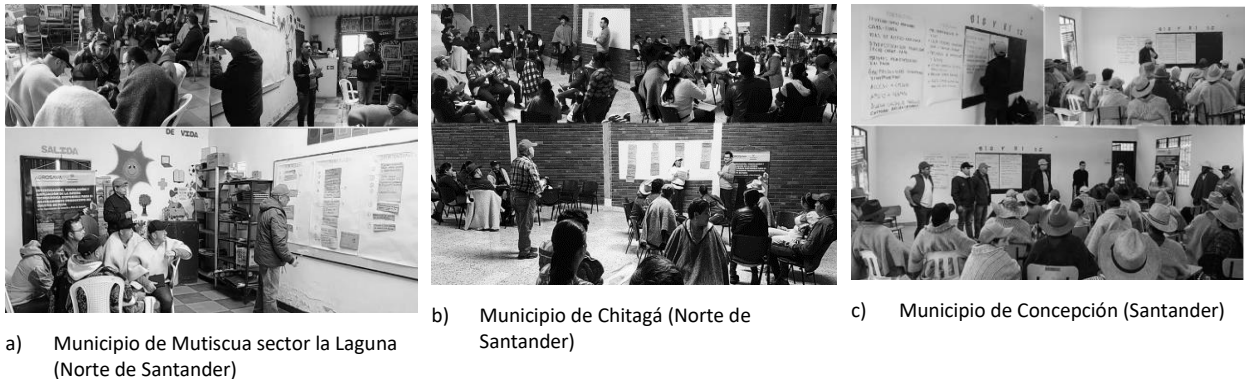
Figura 1. Ejercicios de aplicación de análisis FODA

metodología planteada por Geilfus (2002); Ramírez (2009), Lima de Almeida, y Gaia (2014) la que aborda tres pasos generales, una ambientación e explicación, lluvia de ideas y priorización.