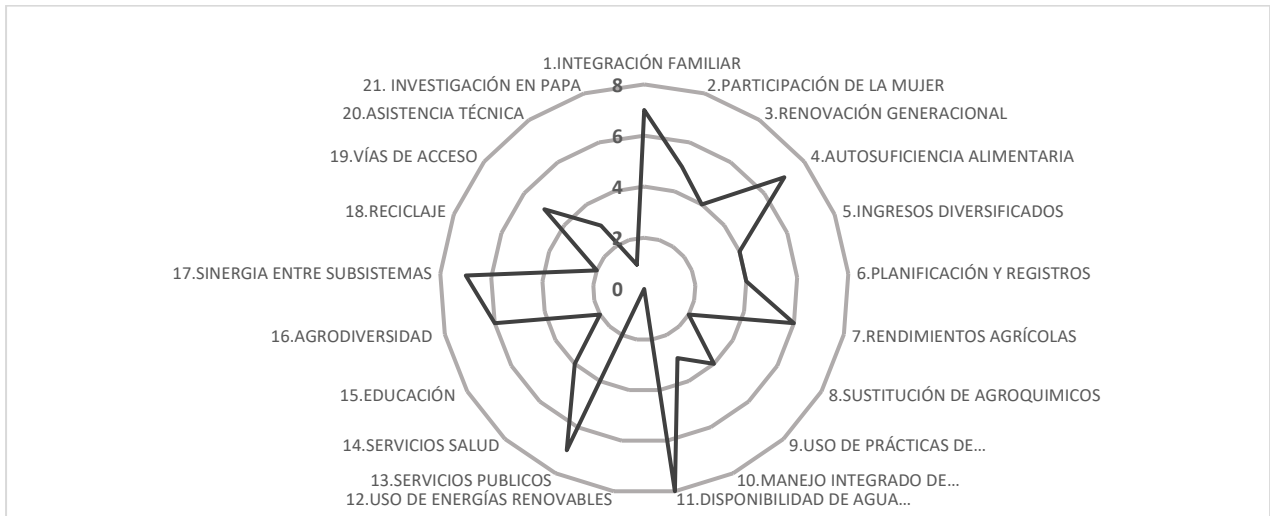
Figura 7. Sostenibilidad del sistema de producción de papa en el municipio de Chitagá

riego con 8 puntos, obteniendo valores intermedios todas las variables salvo transferencia de tecnología y buenas prácticas agrícolas y transferencia de tecnología son las que colocan en peligro el sistema de producción de papa (ver figura 7).