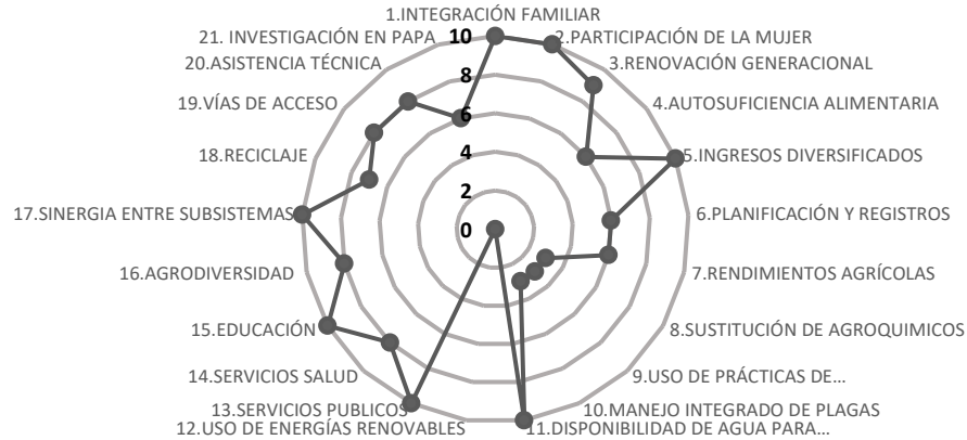
Figura 6. Sostenibilidad del sistema de producción de papa en el municipio de Mutiscua

En el municipio de Chitagá se alcanza un resultado con 91/210 puntos, lo que corresponde a medianamente sostenible o inestable; donde ningún indicador obtuvo puntaje de 10, siendo el indicador con mayor puntaje el de disponibilidad de agua para