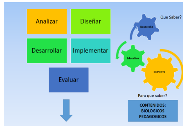
Grafica (1) proceso investigativo en el énfasis de rendimiento.

Se contextualiza el deporte en el campo del rendimiento, se diseñan herramientas que contribuyan a caracterizar y evaluar el proceso del deporte a nivel de las escuelas y clubes deportivos.