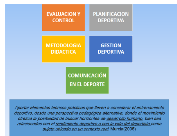
grafica (2) líneas de trabajo del énfasis de rendimiento

Y la última fase es establecer instrumentos de evaluación y control en la aplicación de la didáctica en este campo.