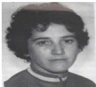
Figura 2. La ciclista Mercedes Ateca, 1ª Campeona de España de ciclismo (Imagen de archivo)