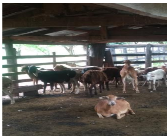
Figura 4. Establo de caprinos

Algunas veces para cumplir con el requerimiento de la mezcla, se recolectó estiércol caprino de un establo aledaño, donde los chivos tienen el mismo tipo de alimentación que los propios de la finca.