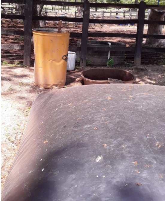
Figura 5. Tanque amarillo para la mezcla de las excretas antes de verterlo en el biodigestor