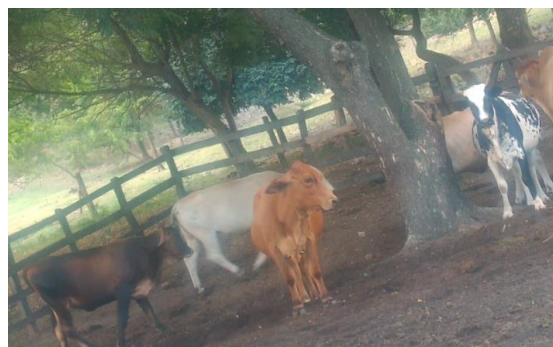
Figura 3. Establo de bovinos

Todo el día se recolectaba la excreta fresca y se mezclaba en un tanque con una porción de agua, dejándose reposar por algunas horas, antes de verterla dentro del biodigestor (Ver figura 5).