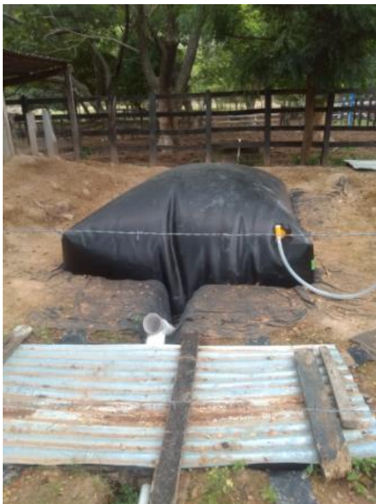
Figura 2. Biodigestor sistema bio 8 instalado.