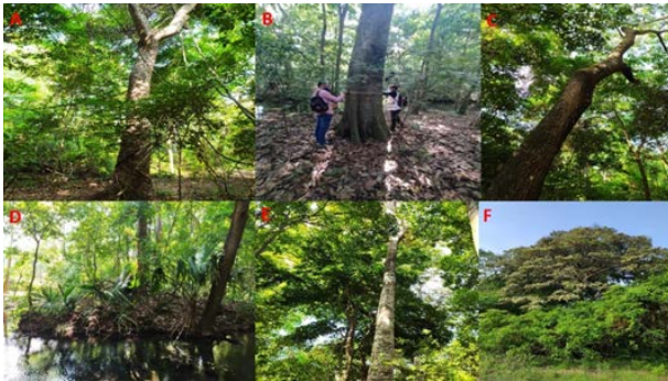
Figura 4. Flora. A. Cieba. B. Higuierón. C. Algarrobito. D. Palma grata. E. Lechoncito. F. Piñón.

las condiciones de suelo permiten la presencia de una vegetación de tipo arbórea (Corporación Autónoma Regional de La Guajira – CORPOGUAJIRA, 2015).