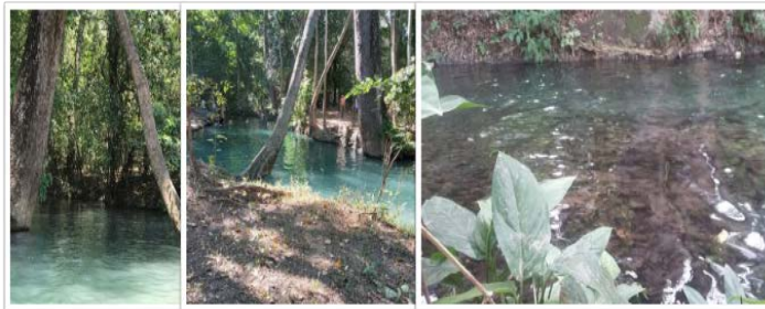
Figura 2. Manantial Cañaverale.

La Reserva Forestal Protectora Manantial de Cañaverales se encuentra ubicada en el corregimiento de Cañaverales, en el extremo noreste del municipio de San Juan del Cesar, corresponde a un ecosistema de bosque seco tropical, cuya particularidad radica en la presencia de afloramientos de agua (Figura 2) subterránea cristalina, de donde los habitantes urbanos y rurales que residen en este distrito se abastecen para el consumo humano y para el desarrollo de sus actividades productivas.