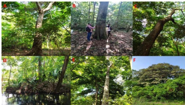
Figura 4. Flora. A. Cieba. B. Higuierón. C. Algarrobito. D. Palma grata. E. Lechoncito. F. Piñón.

las condiciones de suelo permiten la presencia de una vegetación de tipo arbórea (Corporación Autónoma Regional de La Guajira – CORPOGUAJIRA, 2015).