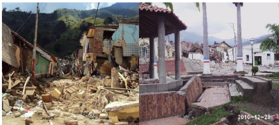
Figura 3. Suelo urbano afectado

El municipio de Gramalote poseía una población para la fecha del desastre de aproximadamente 6.000 habitantes, de los cuales el 50% vivía en el suelo urbano.