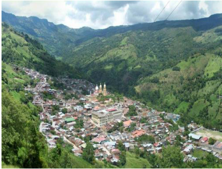
Figura 2. Antiguo suelo urbano municipal