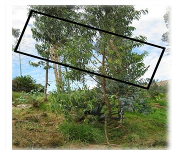
Figura 1. Plantas adultas ubicadas en las áreas de la Universidad de Pamplona

en trozos de 3 a 4 cm. La extracción del aceite esencial se extrajo por arrastre de vapor en el laboratorio de química de la Universidad de Pamplona.